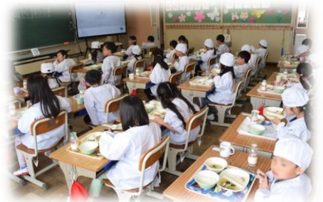
1年生 初めての給食