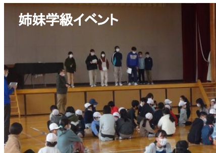
姉妹学級イベント

2学期もたくさん、児童会企画の活動がありました。高学年の子どもたちがアイデアを出し合い、学校生活を楽しく豊かにするために、がんばってくれました。