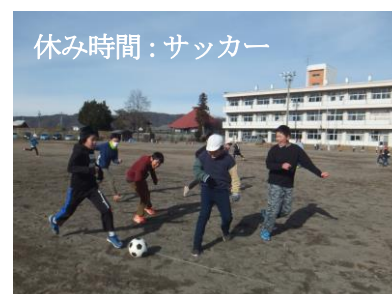
休み時間：サッカー

「え」…「笑顔」 2学期は、それぞれの学年でたくさんの行事や活動をすることができました。遠足、社会見学、修学旅行に行ったり、生活科や総合的な学習の時間の活動ができたりして、みなさんの笑顔